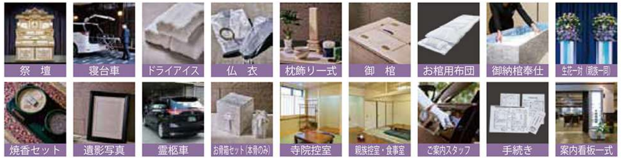
※祭壇・役務アイテム写真はすべてイメージです。ご希望される会場によりタイプ形が異なりますのでご確認ください。

B コース直葬 (通夜式・告別式などを行わず火葬のみを行うシンプルな葬儀プラン) もございます。